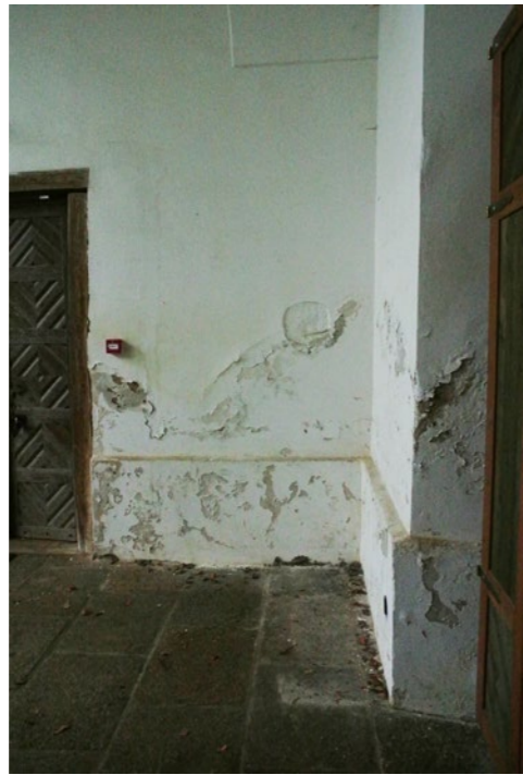
Stav vnitřních omítek v roce 2023, po odstoupení městysu od nájemní smlouvy se spolkem Otisk.