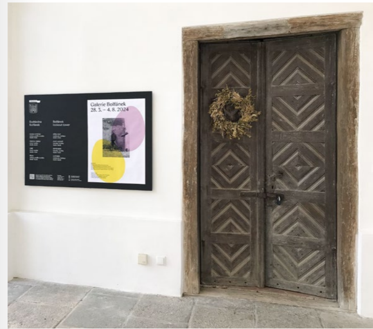
Rehabilitovaný a stavebně upravený vstupní prostor podvěží s novou pokladnou a vícejazyčným informačním systémem—zahájení sezony 2024.