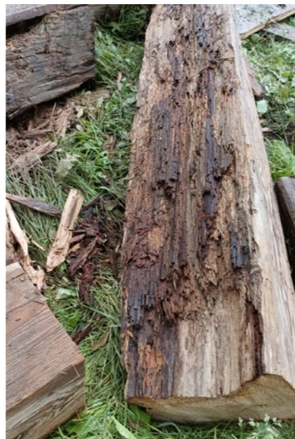
Výměna havarijního stropu ve 4. nadzemním podlaží s obnovenou dřevěnou podlahou.