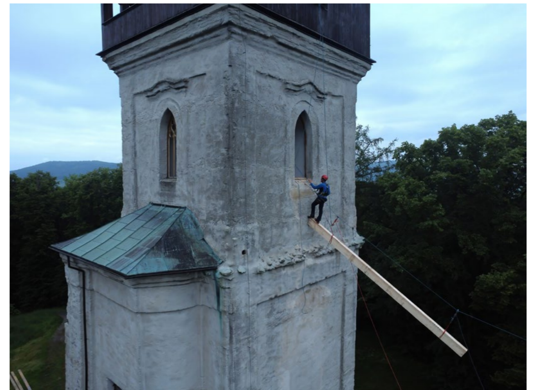
Doprava nových trámů lanovou dráhou k výměně stropu ve 4. nadzemním podlaží věže.

S obdobným postupem bylo kalkulováno v místě dřevěného stropu 4. podlaží. Při zahájení demontáže podlahových prken byl však zjištěn havarijný stav nosných trámů. Vzhledem ke skutečnosti, že nebylo možné časově vyloučit kolaps a destrukci celého stropu, rozhodl stavební dozor o jeho okamžitém snesení. Návrh dalšího postupu byl zpracován na základě operativně přijatých opatření ve spolupráci s projektantem, městysem a NPÚ. Bylo rozhodnuto, že nové trámy budou osazeny ve stejném počtu a stejných dimenzích. Jejich povrch byl uzpůsoben dobovému provedení ručním otesáním a po impregnaci proti dřevokaznému hmyzu a houbám byl opatřen ochrannou olejovou lazurou. Ve stejném technologickém provedení byla provedena nová palubová podlaha spojovaná na péro. Veškeré dřevěné prvky musely být dopravovány do 4. NP okenním otvorem v západní stěně věže do výšky cca 20 m na místě zřízenou lanovou dráhou.